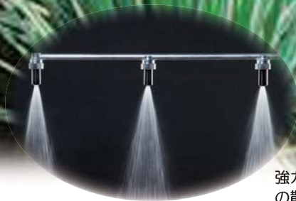
強力キリナシノズルの散布イメージ