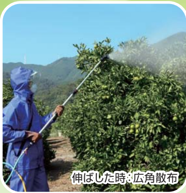
伸ばした時: 広角散布