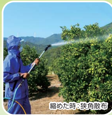
縮めた時: 狭角散布