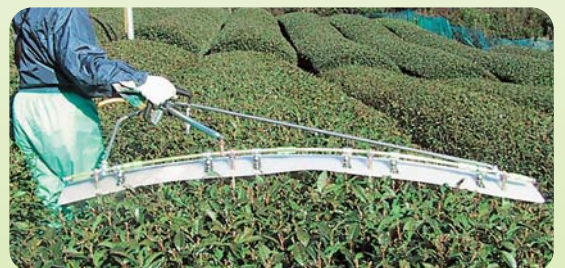
▲カイガラキラーST R3000の散布例