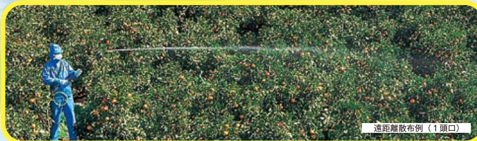
遠距離散布例 (1頭口)