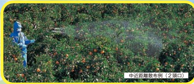
中近距離散布例 (2頭口)