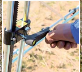
ワンレバーで残液を排出!