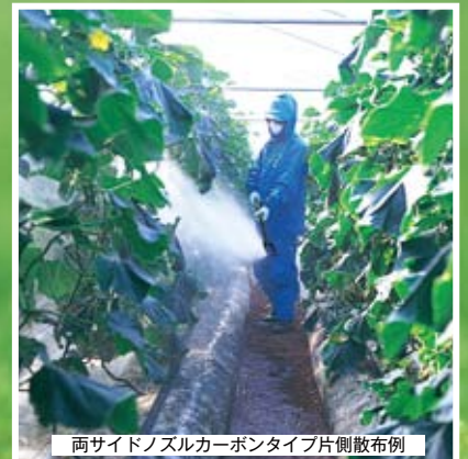
両サイドノズルカーボンタイプ片側散布例

携帯電話でこのQRコードを読み取り、アクセスすることで、噴霧動画を見ることができます。