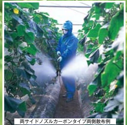
両サイドノズルカーボンタイプ両側散布例