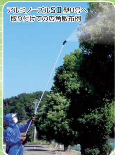
アルミノズルSⅡ型8号へ取り付けての広角散布例