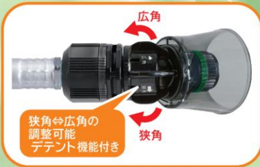
狭角⇄広角の調整可能 デント機能付き

ノズル (標準装備) : NN-ZO-20S 噴出量 (1.5MPa) : 6.7~7.1ℓ/分