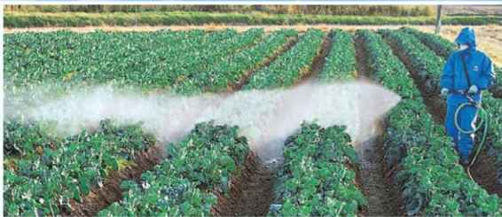
エースガンI型カーボンタイプ散布例

従来のバルブロッド (真鍮製) がカーボン製に変わりました。 バルブロッドは本体内部に組み込まれています。