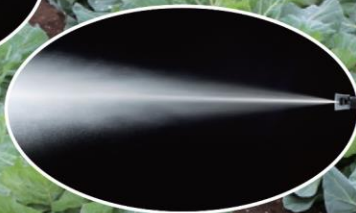
ペットズームII型カーボンタイプ 狭角噴霧