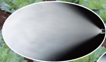
ペットズームII型カーボンタイプ 広角噴霧

ノズル: NN-ZV-20S 噴出量 (1.5MPa) : 5.8~7.2ℓ/分