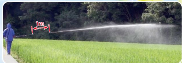
使用例 (切替畦畔カーボンタイプ15型へ延長管1000Lを取り付け)