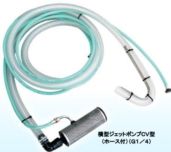
横型ジェットポンプCV型 (ホース付) (G1/4)