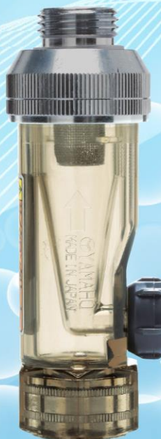
サイクロンクリーナー G1/2