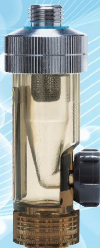
サイクロンクリーナー G1/4