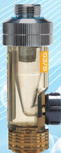
サイクロンクリーナー G3/8