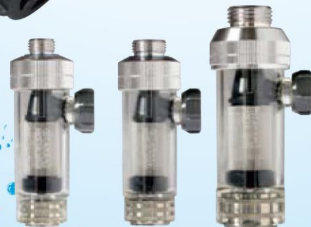
①ライトクリーナー S型(G1/4) ②ライトクリーナー S型(G3/8) ③ライトクリーナー S型(G1/2)